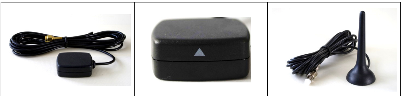
Abbildung der GPS-Antenne, Richtungspfeil (Spitze zeigt nach oben), GSM-Antenne:

Die GPS Antenne darf nicht direkt neben einer bereits vorhandenen GPS-Antenne montiert werden.