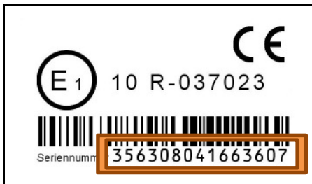
Abbildung des Typenschildes mit Seriennummer:

Notieren Sie sich bitte die Seriennummer des TELEMATIK SYSTEMS welches montiert wird, da diese Nummer für einige Anwendungen benötigt wird.